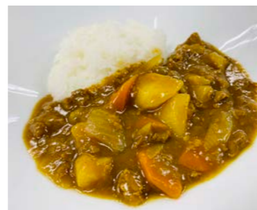
スタッフにも大人気！

りんごジュースはそのまま飲んでももちろん美味しい一品ですが、濃厚なりんごジュースは贅沢に食材として利用しても美味しく楽しめます。カレーを作る際、水の代わりにりんごジュースを入れるだけで、抜群に美味しいカレーが出来上がります。フルーティで味わい深く、子供も大人も大喜び。